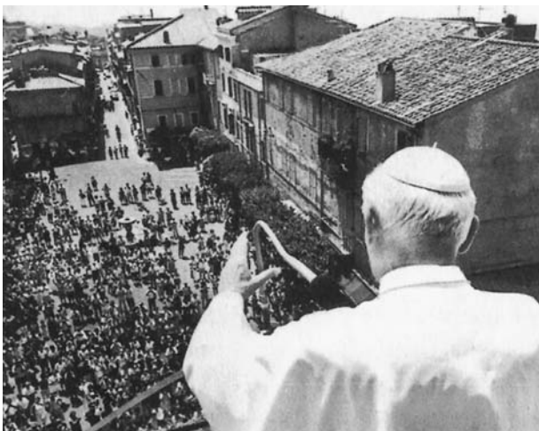
Papež Janez Pavel II. pozdravlja romarje z balkona poletne rezidence v Castel Gandolfu.

zdravnikov. Čeprav tega sprva ni bilo opaziti, ima že dolgo težave s hrbtenico, zato so mu priporočili čim več hrbtne plavanja.