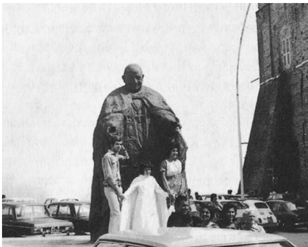
Kip papeža Janeza XIII. pred svetiščem v Loretu.

za zaščito in vojaško pomoč francoskega cesarja Ludvika II., ta pa mu je ustregel šele, ko so ugrabljeni ženski ubili. Hudodelcev niso nikoli odkrili.