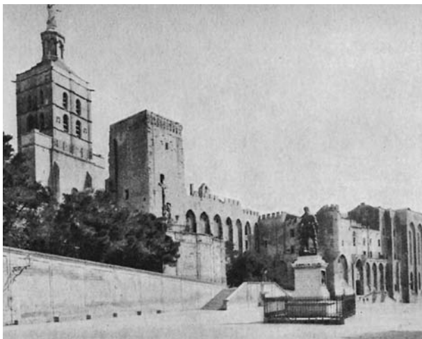
Papeška palača v Avignonu.

do 1376, potem pa se je njihovo prostovoljno izgnanstvo končalo in so se vrnil v Rim.